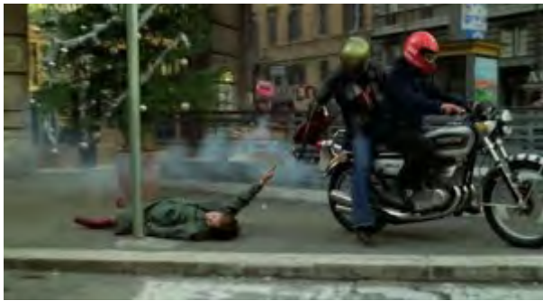
Symbolfoto: Renaissance des Terrorregimes in der Neuzeit?

Es dürfen auch Fragen gestellt werden, wie viele Gerichte derartige Absprachen mit den „SS – L – Geheimen“ haben und somit den Rechtsstaat, in einer leisen Art, als unbemerkten terroristischen Staatsstreich hin zu einer Renaissance des Terrorregimes im Sinne des 1000-jährigen Reiches aufgeweckt haben.