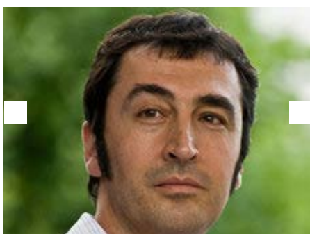
Cem Özdemir , Gründungskurator der Amadeu Antonio Stiftung